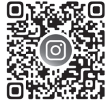
令和6年度 日本歯科衛生士会 会長表彰