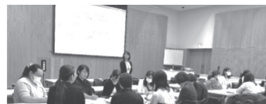
(公益社団法人 日本歯科衛生士会 地域歯科保健委員会)

参加者からは、「行政に勤務する歯科衛生士が集える場の継続を望む」といった声などもあり、今後も、広域かつ高い専門性を求められる行政歯科衛生士が活動するための支援を引き続き行っていく必要性を感じた。